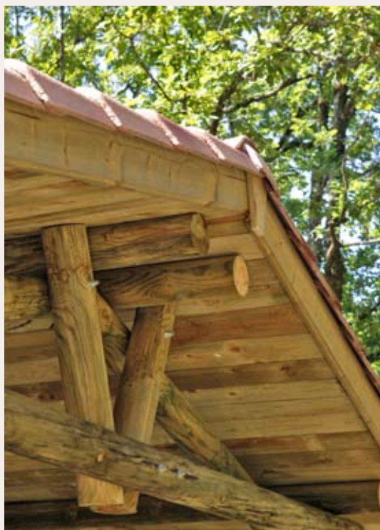
Ferme en rondins de 140 mm