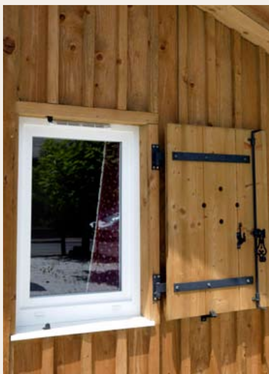
Bardage vertical / Volets bois